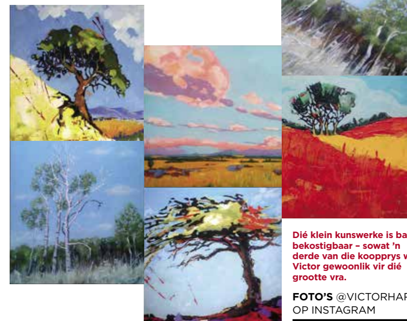
Dié klein kunswerke is baie bekostigbaar – sowat 'n derde van die koopprys wat Victor gewoonlik vir dié grootte vra.